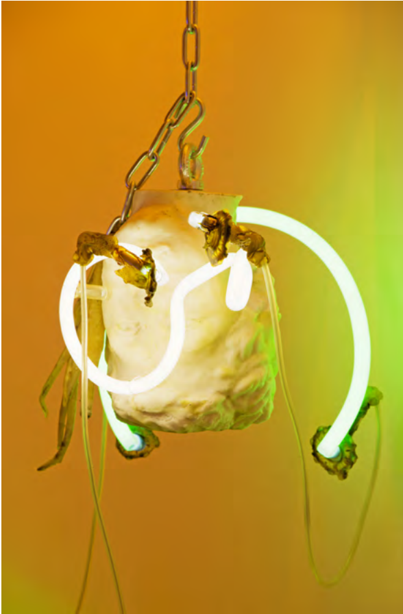
Chloé Delarue, TAF - ACID RAVE, 2019 Musée de la Chaux-de-Fonds