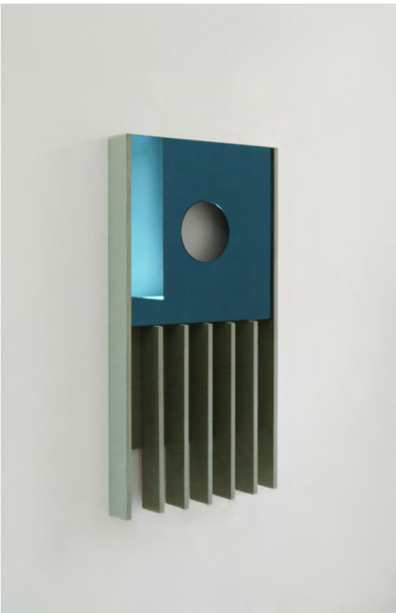
Ludovic Sauvage, SOAP A, 2019, courtesy de la galerie Valeria Cetraro