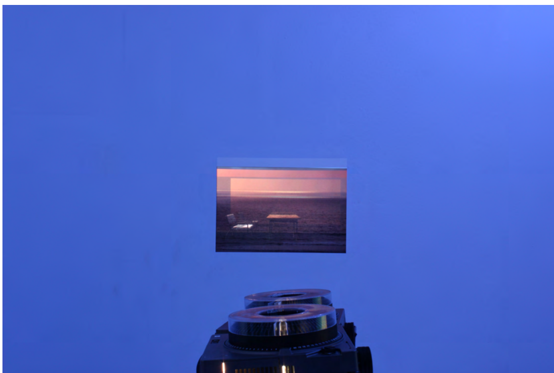
Ludovic Sauvage, Shores, 2015, à Glassbox, crédit Antoine Chesnais, courtesy de la galerie Valeria Cetraro