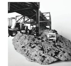
Gaëlle Foray, La fille sous le pont (2015)

Les élèves ont réalisé une représentation 3D d'une montagne ayant des traces de l'intervention de l'homme (constructions, déforestation, pollution...) en réalisant un « collage » dont l'élément principal est une pierre choisie par l'élève. Ils ont également réalisé un collage à plat à partir d'une photo de montagne.