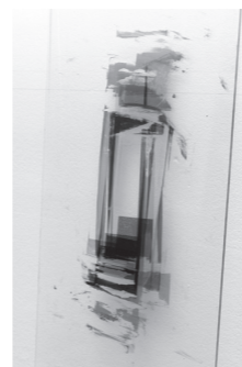
Nicolas Muller, Sans titre (2016)

Les élèves devaient faire une trace libre incontrôlée avec le médium de leur choix (stylo, feutre, peinture). Ils ont ensuite eu à intégrer cette trace dans deux compositions : l'une abstraite, l'autre figurative. La trace est devenue signes pouvant s'interpréter de façon différente.