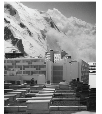
Gaëlle Foray, Architectures et montagnes (2010)

Après avoir visionné un diaporama d'images de montagnes surexploitées, de stations abandonnées, etc. Après avoir évoqué la pollution visuelle et sonore des sommets qui nous entourent, les élèves ont créé leur propre univers à travers une activité de découpage/collage sur une image de montagne format A3 couleur. Pour la seconde partie de l'atelier le collage a cette fois-ci été traité en volume sur des pierres.